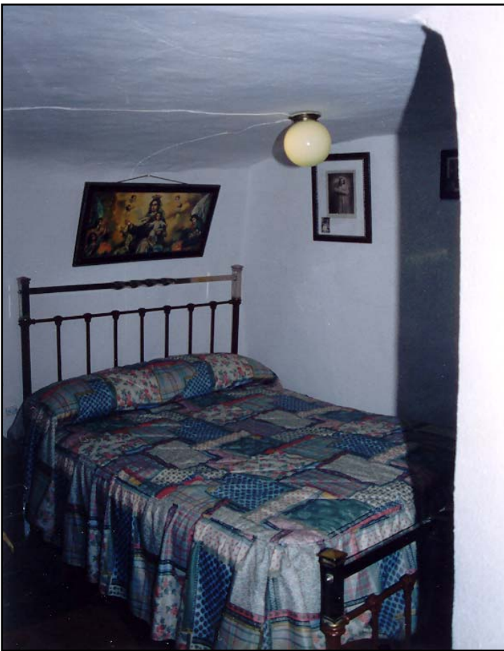
Detalle de la alcoba nº3.