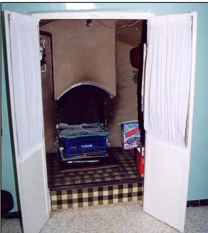
Detalle del hogar.